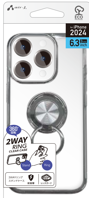
AC-P24-MR BK ブラック