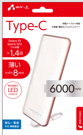
WH(ホワイト×ローズゴールド)