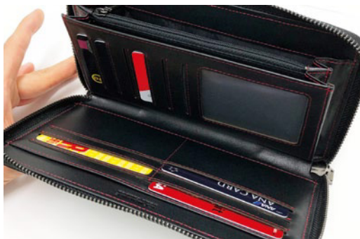
出し入れしやすい大容量収納ルーム