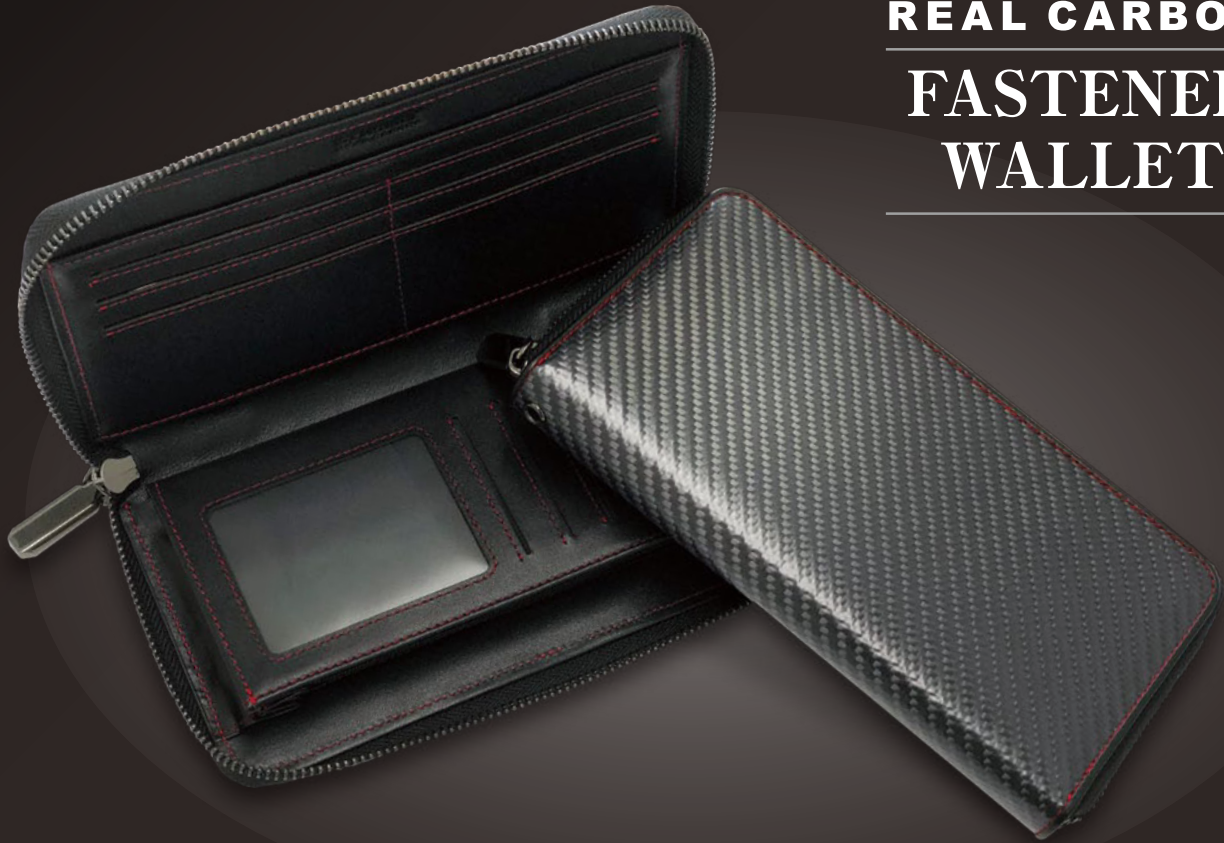
GTR-GT4 ラウンドファスナー長財布 札入れ(2ルーム)、小銭入れ×1、カードポケット×12、多目的ポケット×1 素材:リアルカーボン・本革