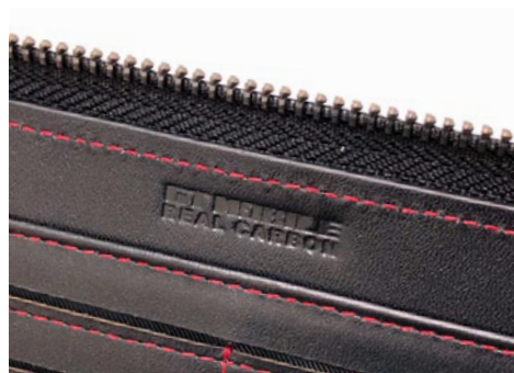
高級感のある本革型押しロゴ